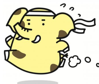
新座市イメージキャラクター ゾウキリン