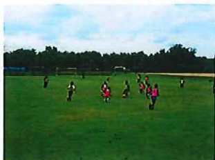
大会会場として使用される市民総合体育館(左)と運動公園